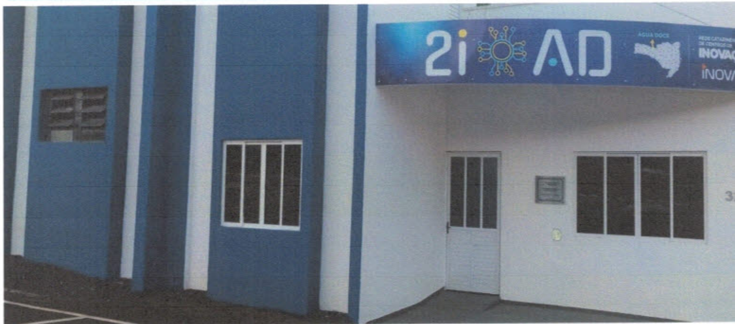
INCUBADORA DE INOVAÇÃO DE ÁGUA DOCE – 2iAD EDITAL 01/2023